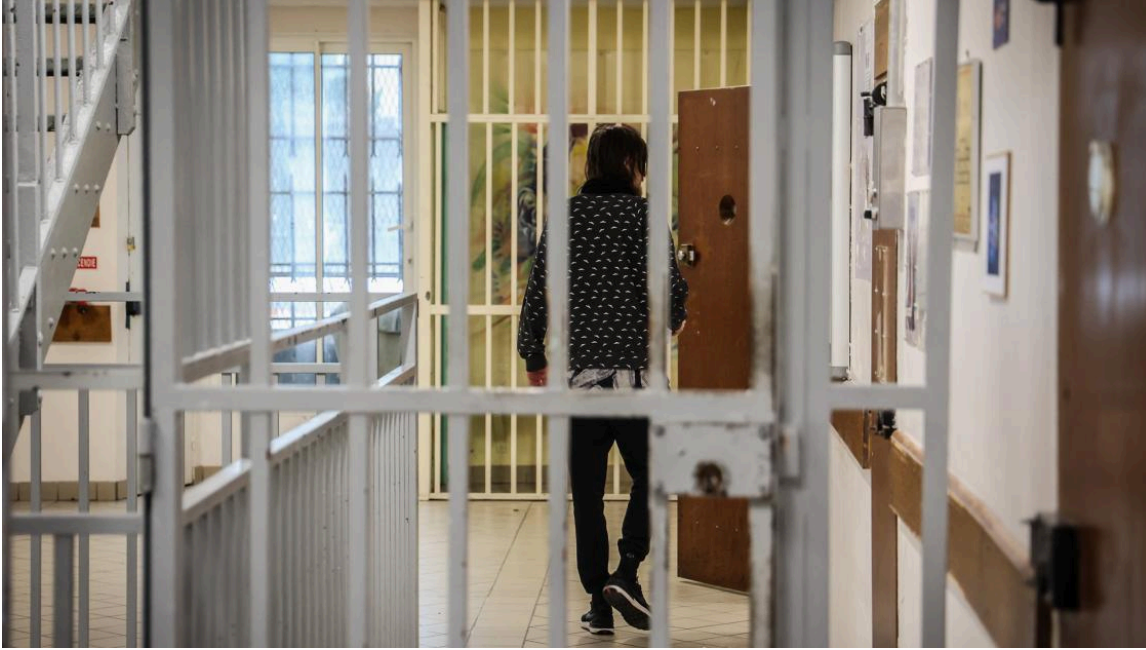
Le jeune homme devra effectuer deux années de détention - S.J.